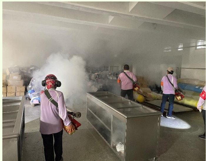
清除孳生源及化學防治示意圖

登革熱的防疫工作應是全民參與，請民眾務必於出國前將住家環境中的積水容器清除倒置，出國期間做好防蚊措施，返國後做好正確自主健康管理2週，如有發燒、頭痛、後眼窩痛、肌肉關節痛、出疹等登革熱疑似症狀時，請務必立即就醫，避免於公眾場所徘徊，並切勿服用退燒藥，且於就醫時主動告知旅遊史和接觸史，俾利醫療人員能及早診斷治療，衛生單位即時進行相關防治措施，以維護個人、家人及社區的健康。