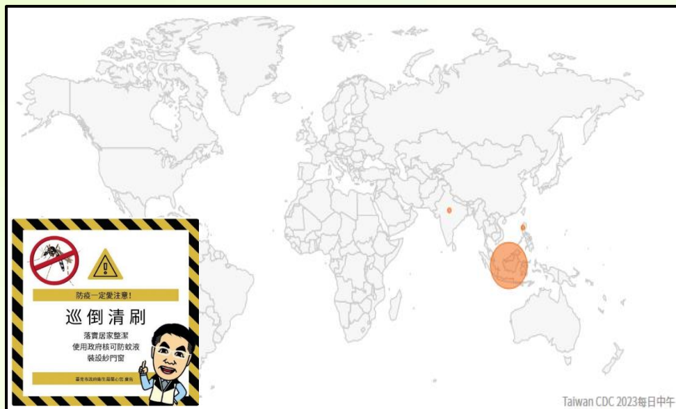
Taiwan CDC 2023每日中午

登革熱部分症狀與 COVID-19 相似，請民眾留意自身健康情況，如有規劃至 東南亞、南亞國家 旅遊或探親，請於出遊前做好防蚊措施，塗抹衛生福利部核可的防蚊藥品，長時間在戶外活動時，建議穿著長袖衣褲避免蚊蟲叮咬。